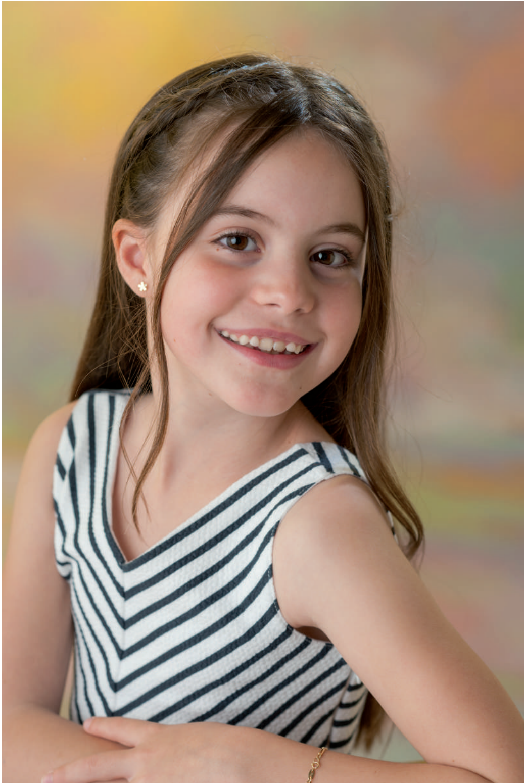
Gal·la Pradas Elco Representant Major Infantil Penya Alfacs